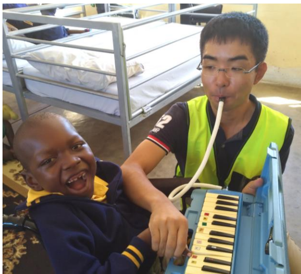
JICA（青年海外協力隊員）として南アフリカへ。障害を持つ子どもたちにピアノを通して音楽の楽しさを伝える