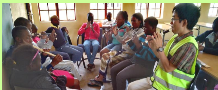
リコーダー演奏はみんな大好き