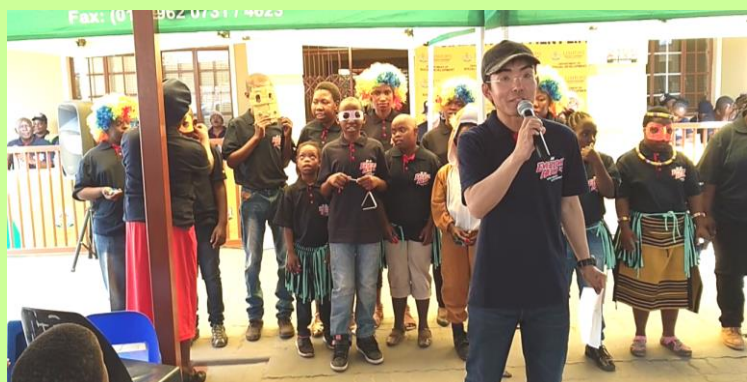
カジュアルデイのイベントで発表

言葉や食事の苦労はあるものの、南アフリカでの障がい児・者との関りによって、日本の苦しい思い出が楽しい体験に上塗りされ自己肯定感アップに。